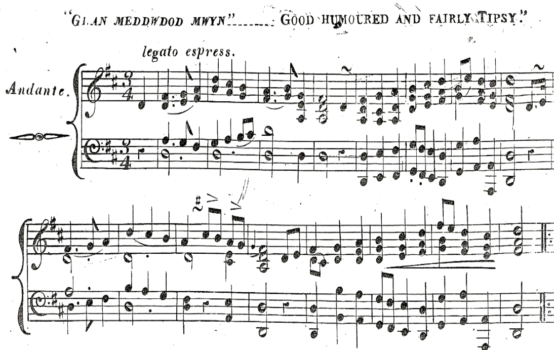
Ffigwr 5.3 277

Ond, er i nifer o'r baledi hyn fod yn ffraeth ac yn llawn hiwmor, gwelir fod ambell faled yn troi o'r ffraeth i'r prudd a'r hiwmor yn datod wrth dynnu sylw at ddifrifoldeb y sefyllfa. Gwelir baledi megis Galar Gwraig y Meddwyn 278 yn sôn am wraig, ran amlaf â baban ifanc yn ei chol neu ar ei bron, yn wylo oherwydd meddwdod ei gŵr. Defnyddia'r baledwr yr holl dechnegau yn ei allu i ennyn emosiwn a chydymdeimlad oddi wrth ei gynulleidfa. Rhydd ddarlun o ferch ifanc yn wylo oherwydd iddi weld tristwch ei mam, ynghyd â newyn y plant o ganlyniad i dlodi, ac ymdrech fythol y fam i ddarparu ar gyfer ei theulu drwy bob math o amodau. Mae'r ffaith i fywyd y