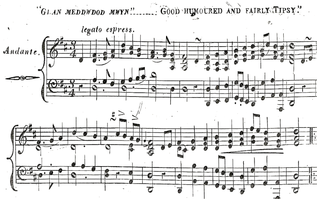
Ffigwr 5.3 277

Ond, er i nifer o'r baledi hyn fod yn ffraeth ac yn llawn hiwmor, gwelir fod ambell faled yn troi o'r ffraeth i'r prudd a'r hiwmor yn datod wrth dynnu sylw at ddifrifoldeb y sefyllfa. Gwelir baledi megis Galar Gwraig y Meddwyn 278 yn sôn am wraig, ran amlaf â baban ifanc yn ei chol neu ar ei bron, yn wylo oherwydd meddwdod ei gŵr. Defnyddia'r baledwr yr holl dechnegau yn ei allu i ennyn emosiwn a chydymdeimlad oddi wrth ei gynulleidfa. Rhydd ddarlun o ferch ifanc yn wylo oherwydd iddi weld tristwch ei mam, ynghyd â newyn y plant o ganlyniad i dlodi, ac ymdrech fythol y fam i ddarparu ar gyfer ei theulu drwy bob math o amodau. Mae'r ffaith i fywyd y